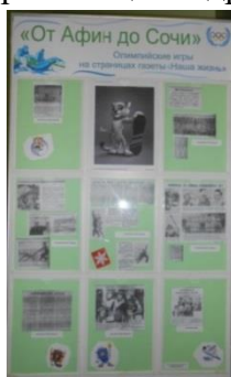
Стендовая выставка «От Афин до Сочи» и книжная выставка «Олимпийский огонь золотой» Центральная библиотека с. Вьльгорт