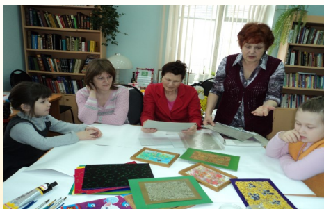
Мастер-класс в читальном зале