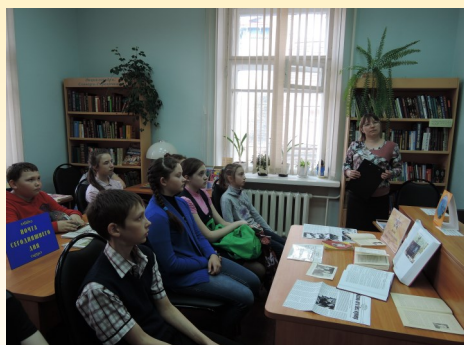
«С любовью о Норвегии»

Наш адрес: 168220, Республика Коми, Сыктывдинский р-н, с. Выльгорт, ул. Д. Каликовой, д.60