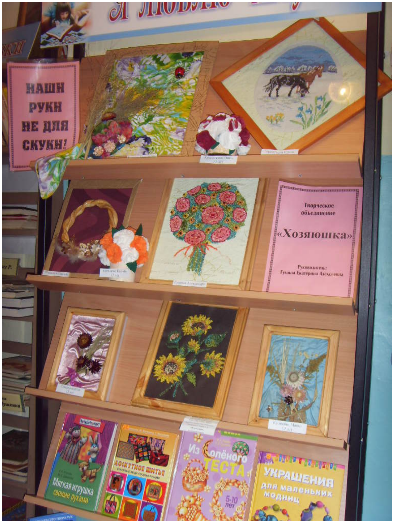
Выставка работ детского творчества «Наши руки не для скуки»