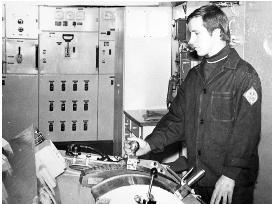
На вахте в машинном отделении судна «Пионер Архангельска».

неволи – благо, паспорт оставался при нем.