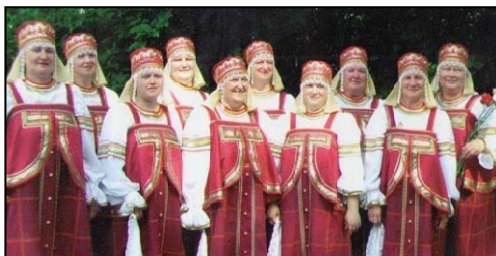
Вокальный ансамбль «Задоринки»

И сегодня клуб – основное место отдыха для жителей посёлка. По праздникам ставятся концерты, проводятся вечера отдыха. С концертами приезжают коллективы художественной самодеятельности из сёл района. С 2004 года в посёлке свой коллектив художественной самодеятельности – вокальный ансамбль «Задоринки». Они принимают активное участие в культурно-общественных мероприятиях посёлка и района.