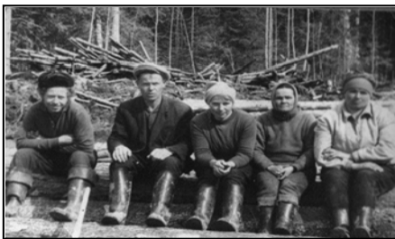
Рабочие на лесозаготовках 1960 год

Посёлок Мандач расположен на правом берегу реки Лэпью в устье реки Мандач и находится в 70 км от районного центра села Вьльгорт.