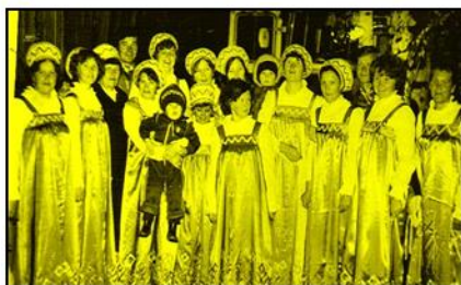
Хор Дома культуры, 1993 год