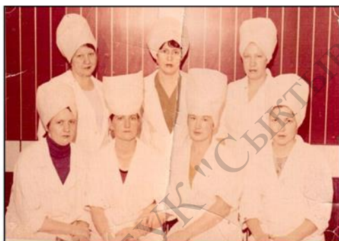
Коллектив столовой Ясногского ОРСа, 1985 год