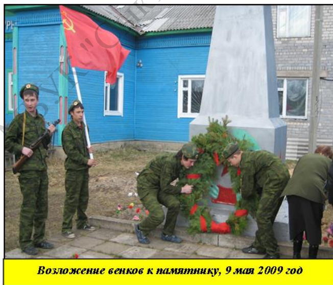
Возложение венков к памятнику, 9 мая 2009 год

В посёлке воздвигнут памятник – дань памяти и павшим, и живым, выдержавшим такое испытание и не сломившимся в те страшные годы, а на Доске памяти высечены имена всех участников Великой Отечественной войны из Яснэга.