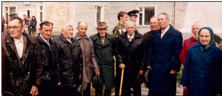
Ветераны Великой Отечественной войны. 9 мая 2000 год