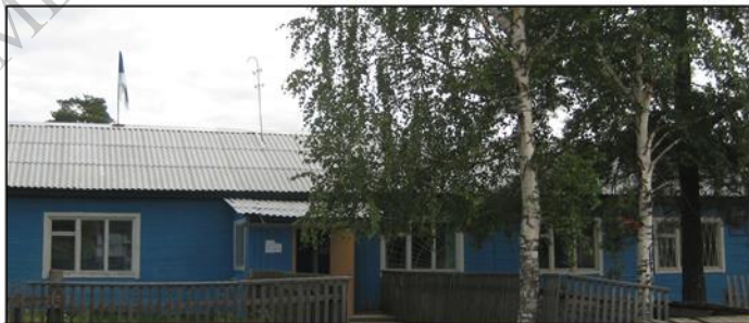
Здание администрации сельского поселения «Яснэг», 2013 год