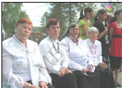
Народный хор Дома культуры, 2009 год

В 1957 году в посёлке был открыт клуб. Главной его задачей на то время являлась «политико-просветительская агитация, обучение, организация досуга жителей». Проводились беседы, лекции, доклады, конференции. Работники культуры систематически освещали ход социалистических соревнований и проводили вечера чествования передовиков производства.