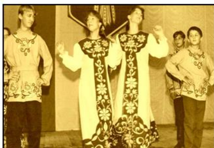
Молодёжная танцевальная группа, 2001 год