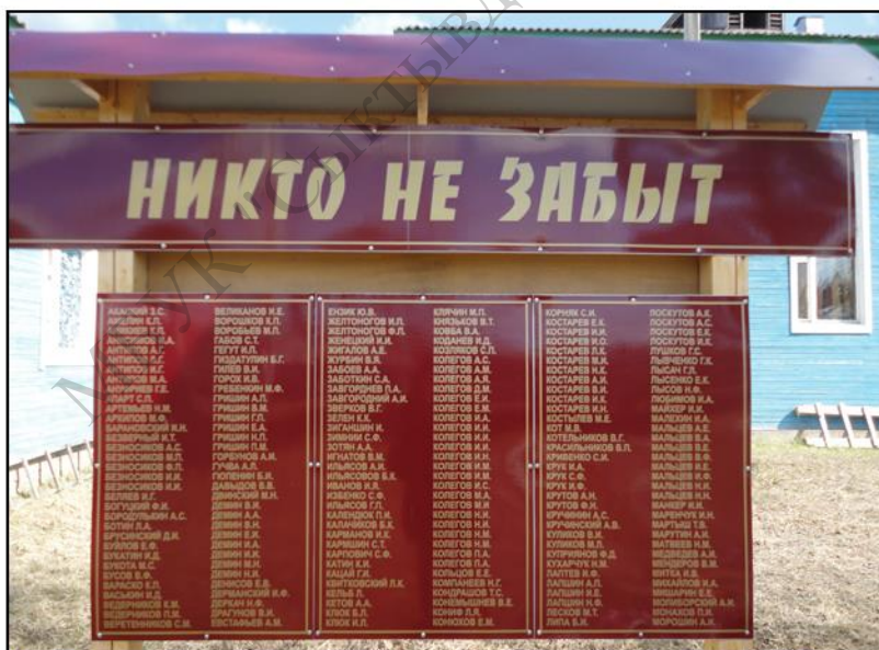
На Доске памяти высечены имена всех участников Великой Отечественной войны, 2013 год