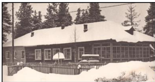
Здание детского сада, 1980 год

Адрес электронной почты: detsadyasneg@yandex.ru