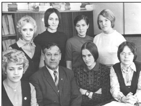
Коллектив Ясногского ОРСа, 1975 год