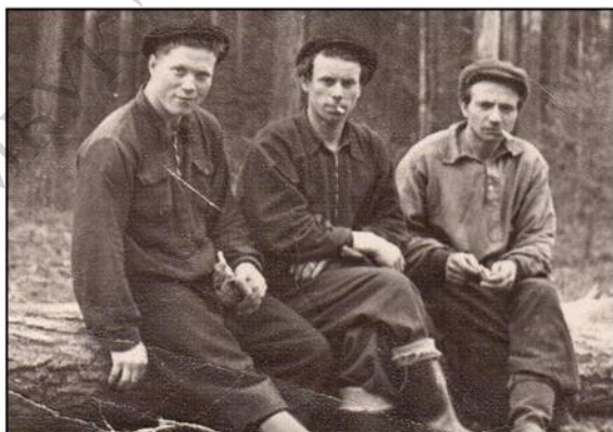
Комплексная бригада на валке леса, 1970 год

С 1950-х годов и до настоящего времени лесозаготовительная промышленность стала главной отраслью в экономике посёлка Яснэг.