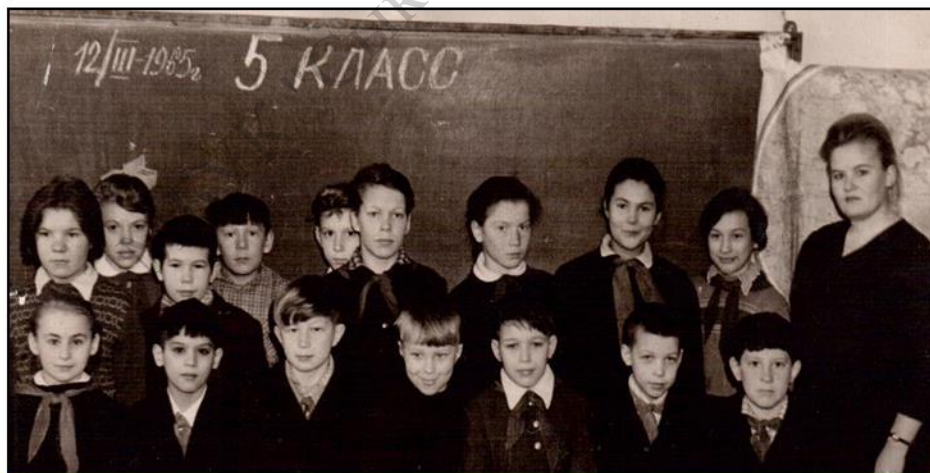
Учащиеся Ясногской школы, 1965 год