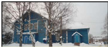
Ыбский Дом культуры

В 1953 году был построен двухэтажный Дом культуры колхозника, ставший впоследствии центром культурной жизни села Ыб. На втором этаже Дома культуры с 1957 года располагалась библиотека.