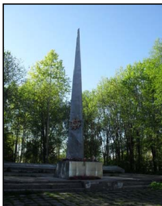
Стела «Штык», Парк Победы

В 1985 году была открыта стела «Штык», а рядом каменные плиты с именами погибших. В честь каждого погибшего на войне посажено дерево.