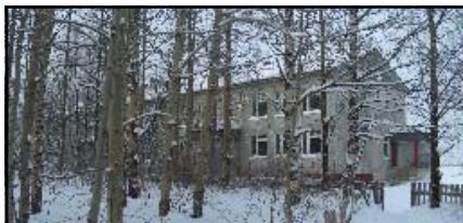
Детский сад с. Ыб