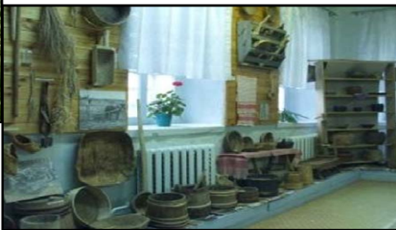
Историко-краеведческий музей им. А.А. Куратовой