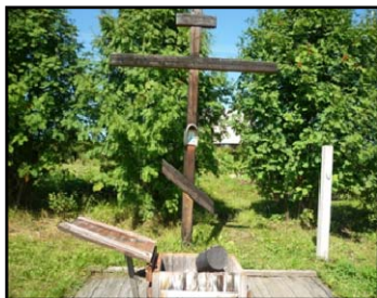
Родник, святой источник Параскевы Пятницы