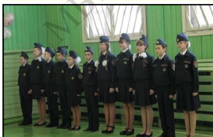
Принятие присяги кадетами Ыбской СОШ

В 1874 году открыто земское одноклассное училище, в котором из 41 учащихся была одна девочка.