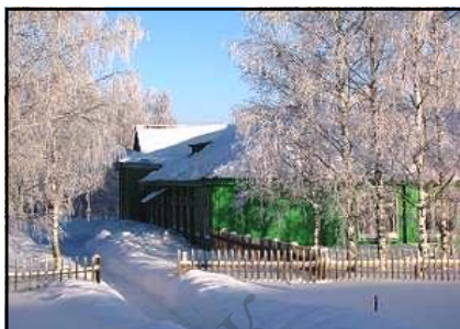
Здание школы, 1965 год