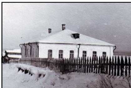
Каменное здание школы, 1892 г.

В 1847 году палатой государственных имуществ открыто Ыбское училище, в котором обучались 30 мальчиков. В 1857 году училище переведено в Вьльгортский сретенский приход. В 1860 году , священником Георгием Поповым открыта церковно-приходская школа.