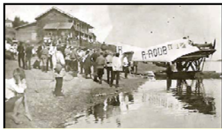
Гидроплан Юнкерс F-13

В 1964 году появился первый телевизор на селе. В 1981-1987 годы покрыли асфальтом дороги по селу, открыта лыжная база с освещённой лыжной трассой, проведена газификация села (баллоны).