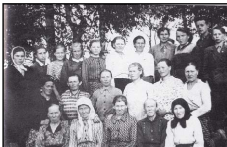
Колхоз «Им. Кагановича», д. Захарово

В селе были свои мельницы, пекарни, кузницы, маслозавод, конюшни. Большой склад был построен для приёма товаров с пароходов и барж. На полях сеяли рожь, ячмень, горох, овёс, сажали морковь, картофель. Животноводы Ыба в конце 50-х годов добились высоких показателей в работе.