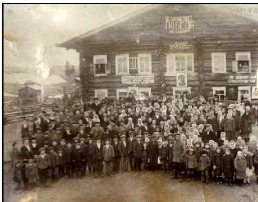
Интернат для инвалидов Великой Отечественной войны, 9 мая 1945 год

Из села Ыб на защиту Отечества ушли 679 человек, из них вернулись назад 187 человека (по другим данным, на фронт ушли 952, не вернулись – 522 человека, по последней версии А.А. Куратовой на фронт ушли 1013 человек, не вернулись – 527 человек).