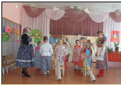
Дети во время игры

С 1 февраля 1987 г. начал функционирование детский сад на 140 мест в с. Ыб. На сегодняшний день в дошкольном учреждении имеется компьютер, музыкальный центр, магнитофон.